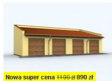
Nowa super cena 1190 zł 890 zł G94 garaż czterostanowiskowy wymiar obiektu: 14.66m x 7m 89.72m 2 890 zł