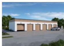
G341 garaż sześciostanowiskowy wymiar obiektu: 19.23m x 7m 115.32m 2 1290 zł

Budujesz osiedla domów mieszkalnych, a może budynki wielorodzinne lub reprezentujesz spółdzielnię, zarząd budynków miejskich, wspólnotę mieszkaniową? Szukasz dobrego pomysłu na wolnostojące garaże wielostanowiskowe? Oto gotowy zestaw dla Ciebie.