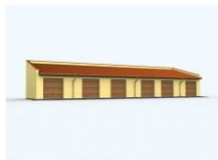
G93 garaż sześciostanowiskowy wymiary obiektu: 26.86m x 7m 157.68m 2 1290 zł