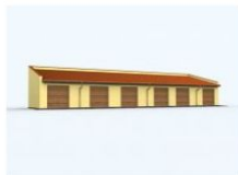
G93 garaż sześciostanowiskowy wymiar obiektu: 26.86m x 7m 157.68m 2 1290 zł