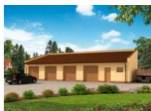
G268 garaż czterostanowiskowy... wymiar obiektu: 18.23m x 7m 112.15m 2 1090 zł