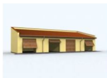
G92 garaż czterostanowiskowy 105m 2 1090 zł