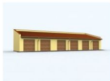
G95 garaż sześciostanowiskowy wymiar obiektu: 22.23m x 7m 134.58m 2 1290 zł